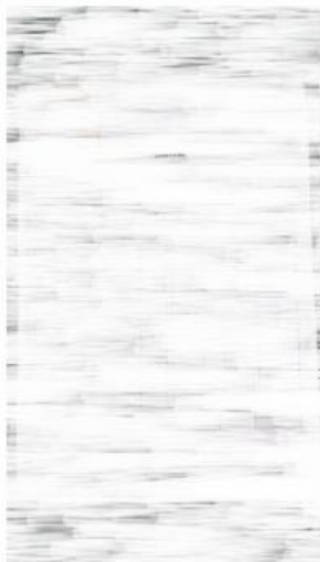
3) Facture entretien récent