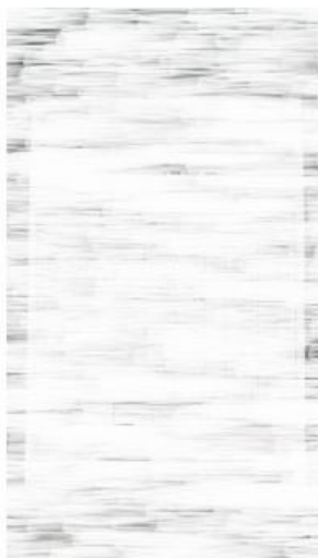
5) Facture de distribution