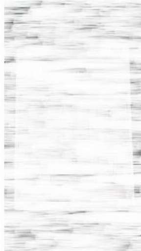
2) Photos carnet ou factures d'entretien