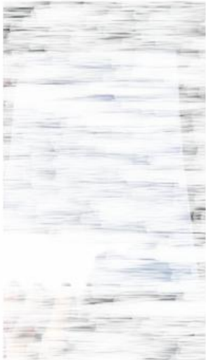
3) Photos carnet ou factures d'entretien