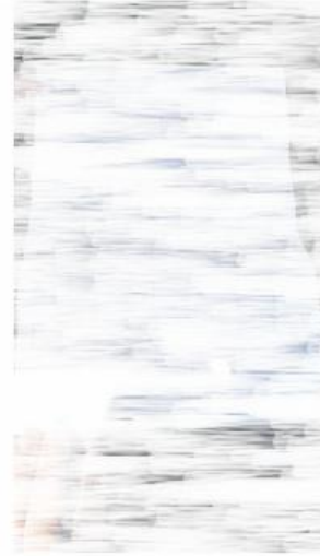
2) Photos carnet ou factures d'entretien